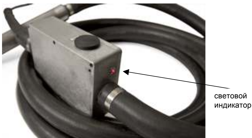
Рис.3 Внешний вид преобразователя и светового индикатора