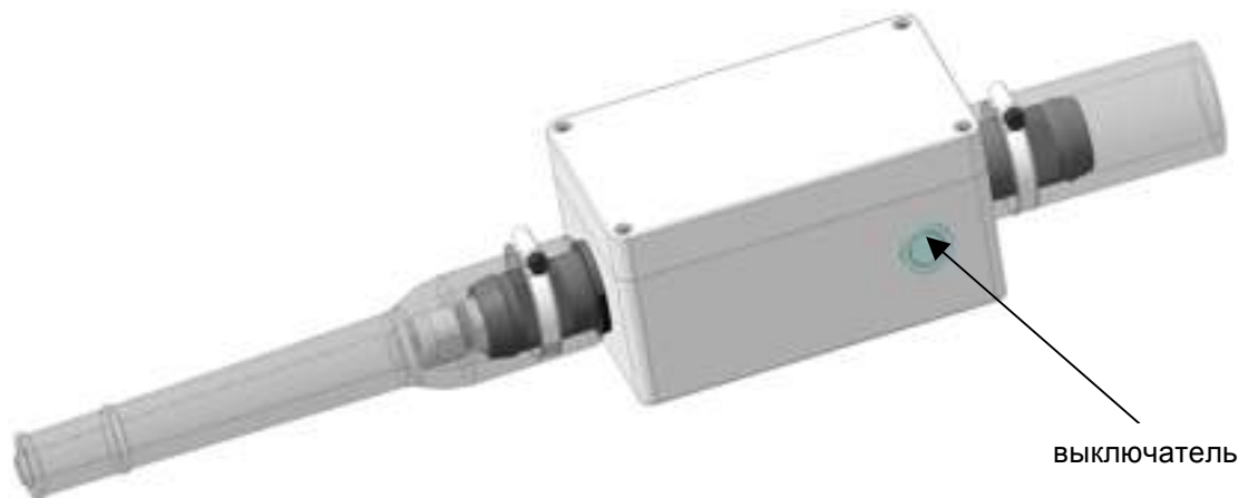
Рис.2 Внешний вид бокса преобразователя с кнопкой включения –выключения.

Включение вибратора производится нажатием кнопки, расположенной на корпусе преобразователя. В этом случае на выходе преобразователя появится переменное напряжение. В течение 2 сек. частота выходного напряжения плавно увеличивается до номинальных 200 Гц - происходит плавный разгон электродвигателя вибратора. Для выключения вибратора необходимо повторно нажать кнопку, расположенную на корпусе, при этом преобразователь переходит в режим ожидания. Для полного отключения необходимо произвести отключение вилки от питающей сети. Преобразователь так же обеспечивает времятоковую защиту электродвигателя без отключения инвертора, а также аварийное отключение электродвигателя при срабатывании защит: