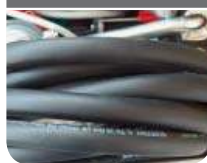
4 m (PIUSI BASIC) 6 m (PIUSI PRO)